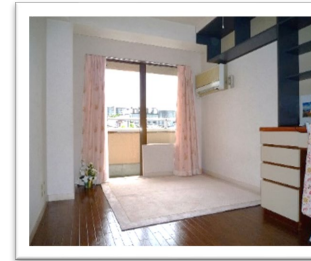
※空室時のモデルルームの写真です。 図面に記載以外のものは付きません。